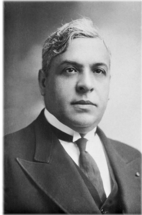
1 Aristides de Sousa Mendes