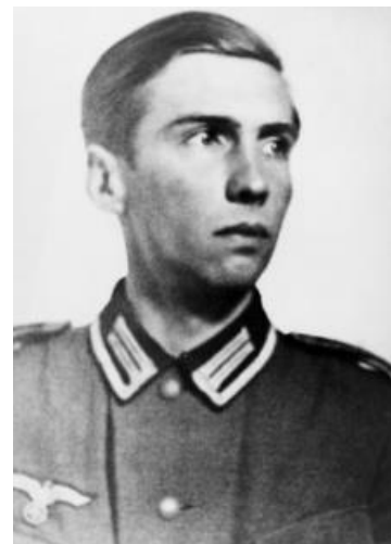
1 Alexander Schmorell in Uniform

Auch wenn er nur wenige Jahre in Russland lebte, war es für ihn Geburtsland und geistige Heimat. Seine russische Mutter starb, als er noch ein Kleinkind war, und sein deutscher Vater zog 1921 mit ihm nach München.